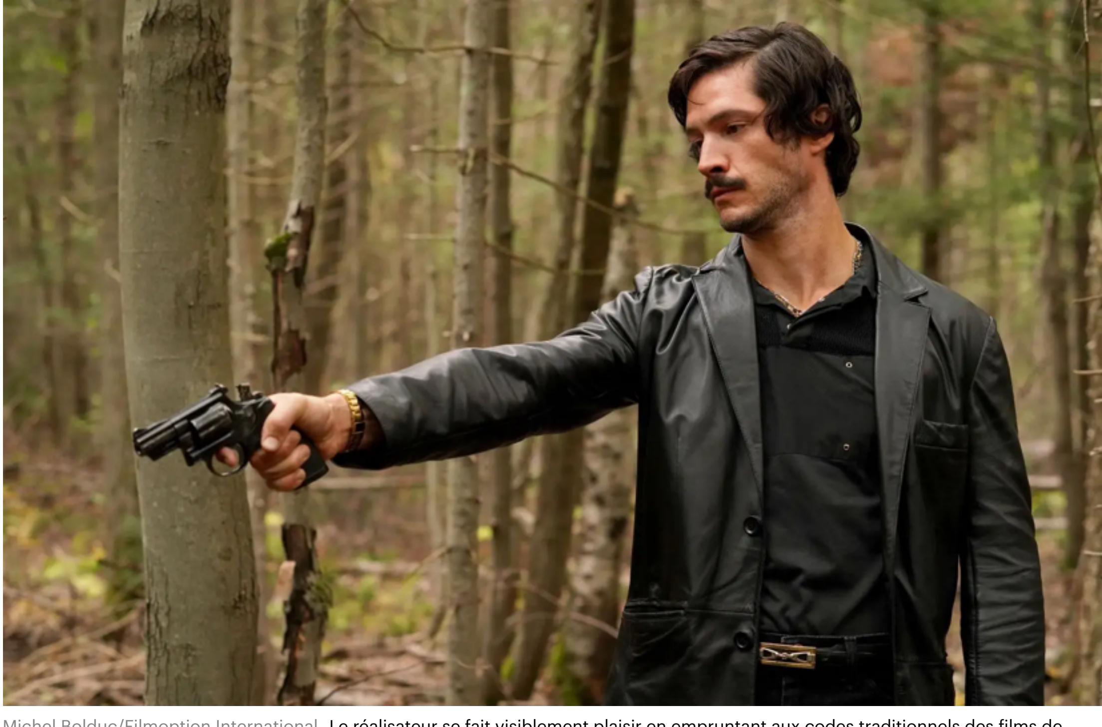
Le réalisateur se fait visiblement plaisir en empruntant aux codes traditionnels des films de gangsters, et choisit donc d'adopter exclusivement le point de vue de son protagoniste.